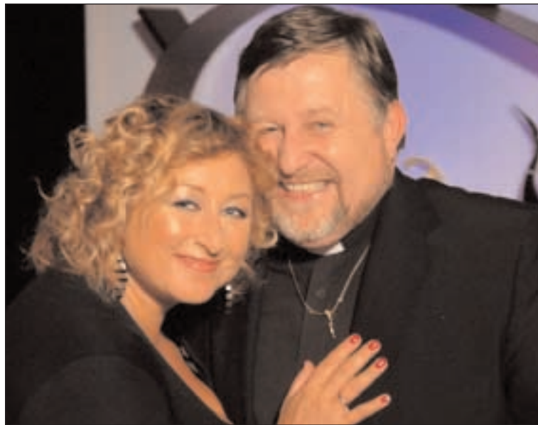
V pořadu Banánové rybičky na ČT1 vystoupí 1. listopadu biskup Jan Hradil