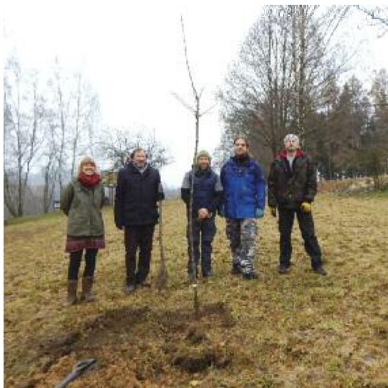
Sázení stromků s účastí bratra patriarchy-správce církve a brigádníků.