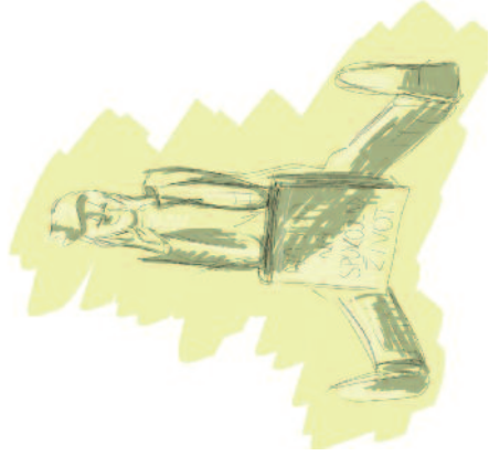
Nakreslila: Lucie Krajčůvková

Církev mezi sebou vedou rozhovory o společném sblížení, jejichž výsledkem je například dohoda o vzájemném uznání křtu, která byla podepsána v roce 1994 zástupci Církve římskokatolické, Českobratrské evangelické a Československé husitské.