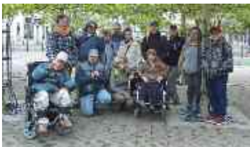
S dobrovolníky střediska Nazaret v Borovanech

V uplynulých dnech život našich středisek poznamenal koronavi-