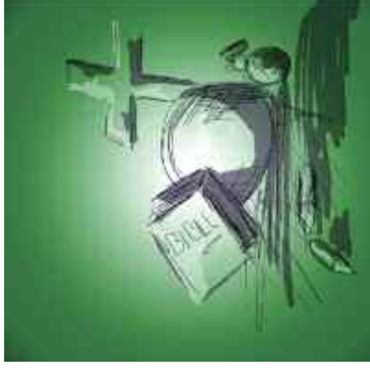
Nakreslila: Lucie Krajčířková

mádu. Alespoň jednou za rok by měl také absolvovat týden duchovní obnovy v rámci své církve. Má-li posilovat druhé, musí sám také sílu čerpat – a kde jinde, než od Boha!