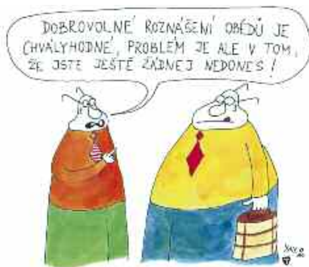
Autor: Tomáš Altman

Na počátku osmdesátých let jsem byl pověřen technologickým zajištěním spolehlivých kvalitních zdrojů chemických surovin nezbytných pro naši kanadskou produkci. K tomu náleželo nenahraditelné osobní jednání s izraelskými partnery v tamní významné chemické exportní a vývojové firmě Dead Sea Works (DSW, Závody Mrtvého moře). Bylo tehdy krátce po ukončení libanonské války a Izrael začal budovat Sar-El program. Zástupci uvedené firmy po uzavření exportní dohody pak přišli s nečekaným návrhem, zda bych se nezajímá o spoluúčast v Sar-El. Byla to lákavá nabídka, souhlasil jsem tedy s třítydenním pobytem. Program byl ve svém počátku flexibilní, uhradili mi tedy část cestovních výloh a po přiletu přidělili stálý doprovod pro celou dobu pobytu, včetně sabatů. Instruktorka, jež měla na starosti eskort, sabra