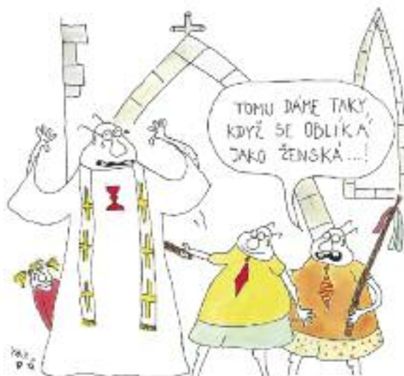
Ilustrace: Tomáš Altman