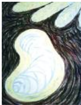
Kresba: Tomáš Novák

Ale žádné křesťanské svátky nejsou sváteční idylou a nezávazným sněním. Velikonoční jitro, o němž svědčí Bible, začíná přec u hrobu. Tehdy tam bylo vše jinak, než naše „veselé Velikonoce“ v běžném konzumním vydání. Byl tu nejprve hluboký úlek a žal. Přece však se obojí nakonec obrátilo v radost, která se šířila a šířila staletími až k dnešku. Zpívají o ní jásavé hymny a duchovní písně: „Bud' tobě sláva, jenž jsi z mrtvých vstal, smrt již nemá práva, vítěz tys a král...“ Právě odtud pramení všechna radost věřícího člověka a naděje pro něj, pro tento svět. Je založena v poznání, že Bůh v ukřižovaném a vzkříšeném Ježíši z Nazareta protrhl náš hřích