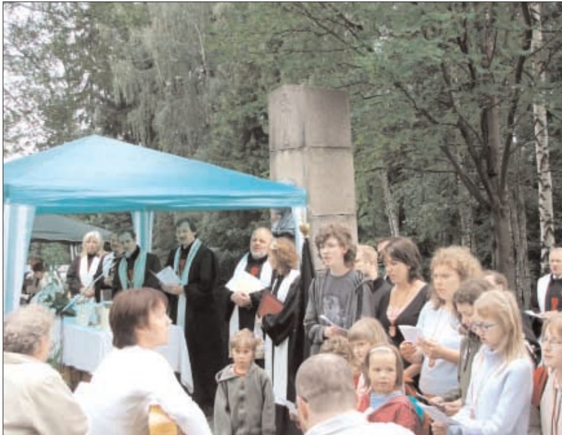
I nejmenší účastníci poutě do Škodějova měli možnost ukázat dospělým, jak pěkně umějí zpívat

Po bohoslužbě se všichni shromáždili na místě, kde stával rodný domek prvního patriarchy, a k pamětní desce položil královéhradecký biskup Štěpán Klásek po modlitbě bratra