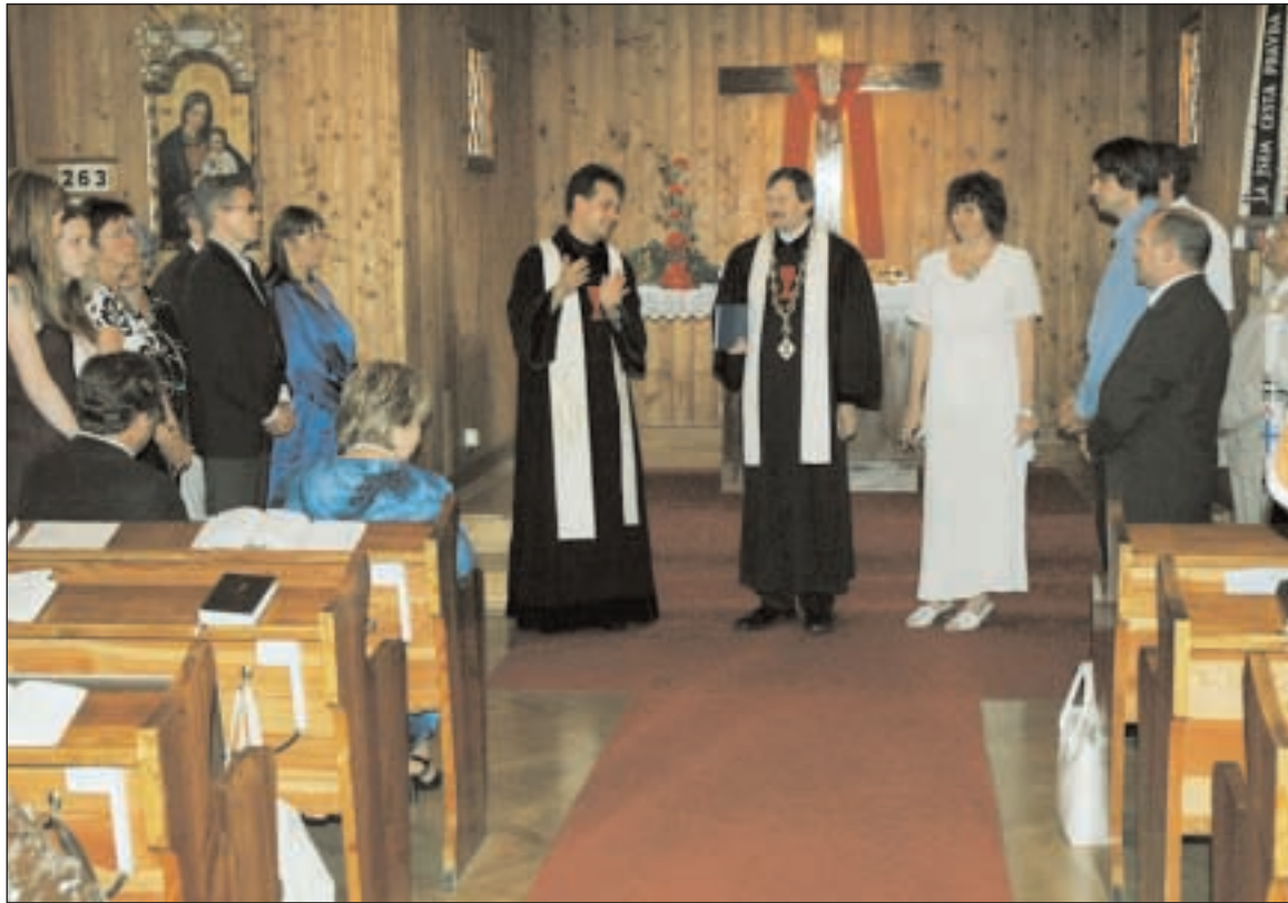
U příležitosti oslav 70. výročí otevření sboru v Blansku přijalo svátost břimování osm sester a bratří

Trvalé hodnoty evangelia, kterými dr. Karel Farský žil a které naši Církev československou husitskou nesou a utvářejí, nemohou být zmařeny žádným lidským selháním, slabostí a pohoršlivým jednáním. Proto vás, sestry a bratři, vybízím, abyste se přimkli ke své