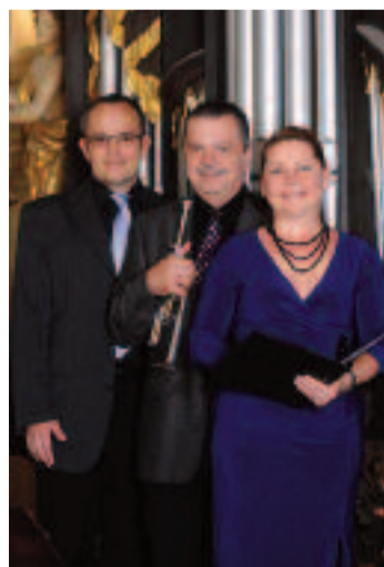
SAINT NICHOLAS CHAMBER SOLOISTS