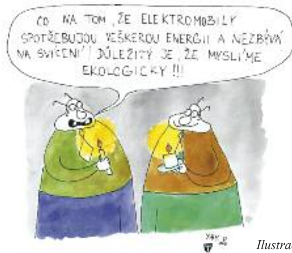
Ilustrace: Tomáš Altman

Jaký tedy vlastně máme výhled z tunelu, který je nám tak účinně zamlžován médii, politickými slogany, fobiemi aktivistů? Jistě, příroda a svět kolem nás čelí vážným existenciálním výzvám. Zároveň se však v něm děje i mnoho dobrého; dochází k fascinujícím objevům i k mno-