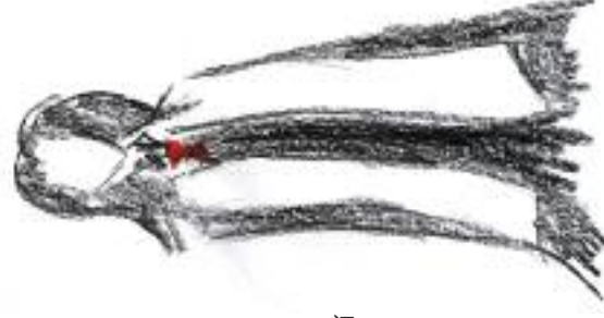
Nakreslila: Lucie Krajčůvková

Ovšem duchovní, zvláště je-li ustanoven do funkce faráře v náboženské