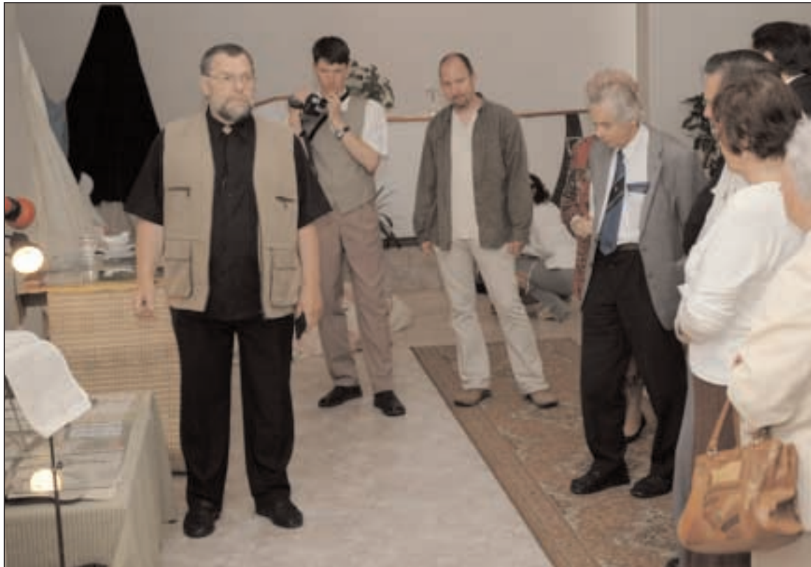
Výstava o životě a díle prvního patriarchy dr. Karla Farského je otevřena v Plzni ve Sboru Kristova kříže

Se vznikem naší církve jsou spojena tři data, tři důležité kroky – Vánoce 1919, 8. leden 1920 a 11. leden 1920. První datum je spojeno se slavením, druhé s ustavením a třetí s obsahovým prohlášením. Novodobá husitská církev nevznikla na schůzi, ale v bohoslužebném prostoru. Slavení bohoslužby v českém jazyce je tím prvním krokem k utvoření samostatné církve. Jestliže Karel Farský o Velikonocích 1919 sloužil v Roprachticích v Podkrkonoší českou mši osamoceně, pak o Vánocích 1919 bohoslužba v národním jazyce probíhala v nespočtu kostelů. Slavení, uctívání a chválení Boha a naslouchání evangelium je zásadním duchovním motivem, ze kterého vznikla naše církev. Druhým krokem byla schůze kněží v Národním domě v Praze na Smíchově. Když sledujeme složité jednání, tak bylo zřejmé, že se z lidského pohledu se vznikem nové církve ne-počítalo. Řečníci vystupovali většinou proti tomu. Ale nakonec hlasování dopadlo nečekaně ve prospěch vzniku nové církve, která v tu chvíli byla za vedení dr. Karla Farského ustavena. A třetím krokem se stalo prohlášení z 10. ledna 1920 přečtené z kazatelny dne 11. ledna v chrámu sv. Mikuláše v Praze na Staroměstském náměstí. Zde jasně zaznívá, že Československá církev je založená svým jménem jako "církev, to je sbor Páně, na základě evangelia Kristova". Současně je v dokumentu vy-