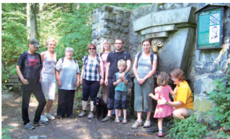
Riegerovou stezkou do NO Semily.