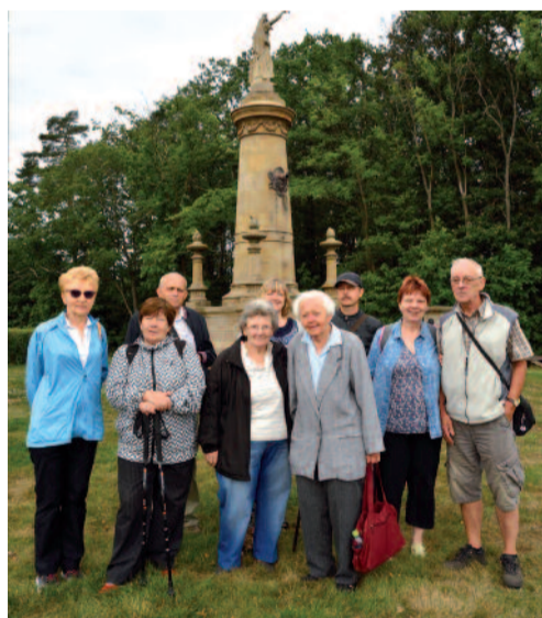
Výlet náboženské obce do roku 1866.

A přestože jsem už studia dávno ukončila, od toho dne, vlastně Noci kostelů, se života náboženské obce v Mladé Boleslavi účastním pravidelně dodnes. V náboženské obci jsem našla fungující společenství lidí, které se pravidelně schází k aktivitě nazvané Setkávání a sdílení, na jejímž programu se podílejí sami účastníci. 1. října