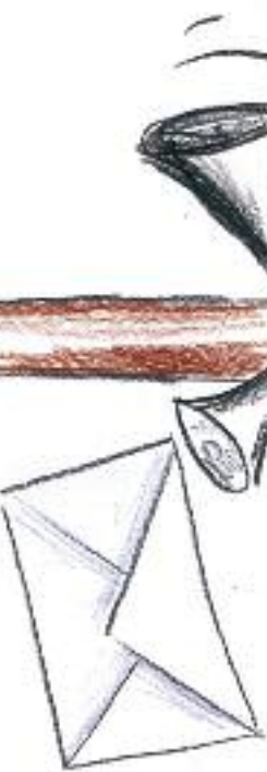
Nakreslila: Lucie Krájčířková

O rychlosti vývoje mobilních telefonů ani nemluvíme. Zhruba v „době faxů“ byl ještě pro většinu lidí mobil, tedy ovšem mnohem větší a s minimem funkcí, záležitostí jen těch nejobhatších. Dnes – dobře víte, jak je to dnes, když přijdete do školy a spolužáci se neustále chlubí nejnovějšími modely nejen mobilů, ale