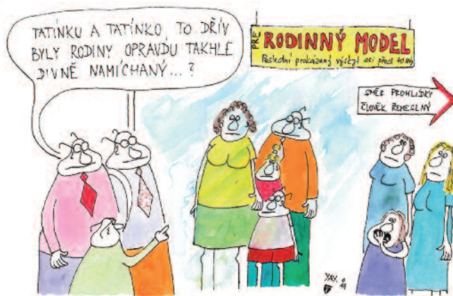
Autor kresby: Tomáš Altman

vřených před civilním oddávajícím a oddávajícím církevním. K rozvodům dochází přibližně stejně – procentuálně něco kolem jedné poloviny sňatků. Můj názor na možnost rozvodu je mnohem tolerantnější než postoj oficiální církve. Člověk v životě nedělá jen dobré a špatné skutky, ale mnohdy se rozhoduje mezi menším a větším zlem. Pokud by trvalí manželství mělo existovat v nenávisti, mělo by plodit zlo, utrpení a špatné prostředí pro děti, je lepší volbou se rozvést. Není to neuvážený výrok, mnohdy se lidé berou velice mladí a vůbec nevědí, co to společný život znamená, co to přináší, a slíbí, že budou „trpět dobré i zlé