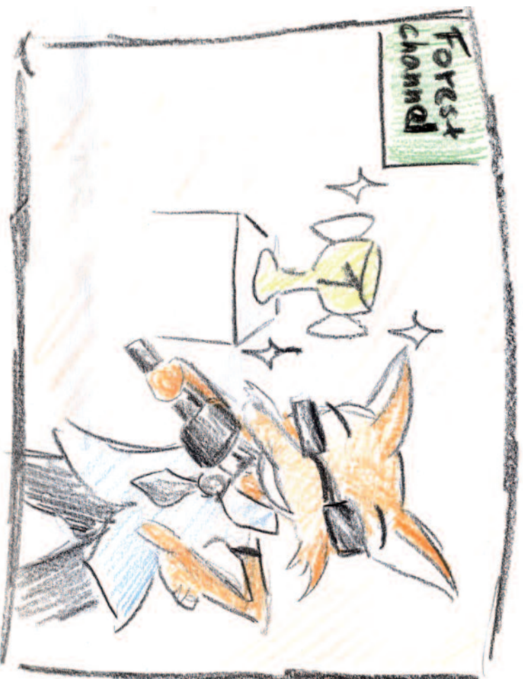
Nakreslila: Lucie Krajčířiková

Mezitím čile probíhaly pohovory a stoupala nervozita před vyhlášením dvaceti finalistů. Nakonec i ti byli známí a slavnostní soutěžní večer byl přede