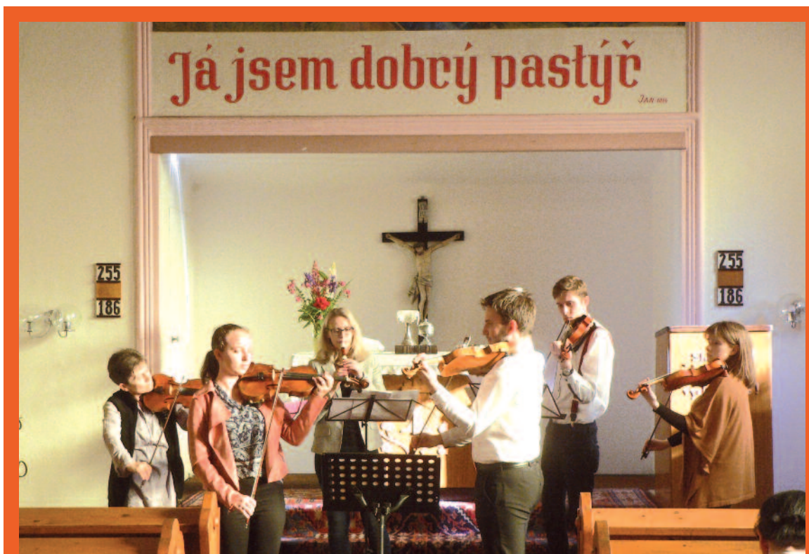
Z Noci kostelů v Husově sboru naší církve v Ostravě - Hrabůvce.