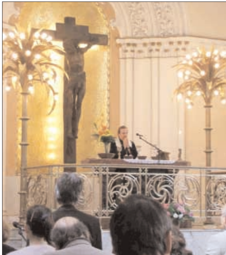
Liturgii vedl brněnský biskup ThDr. Petr Šandera