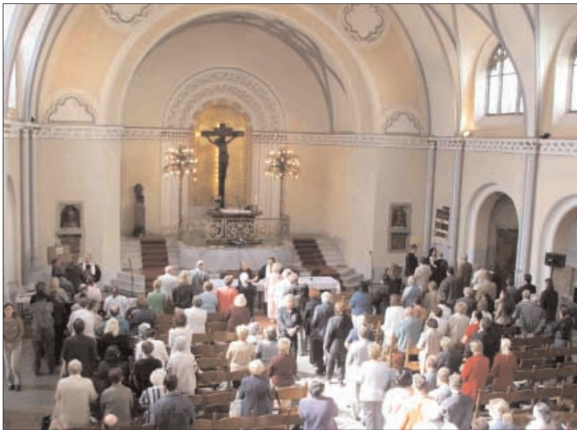
Generální synoda byla zahájena bohoslužbami s vysluhováním večere Páně