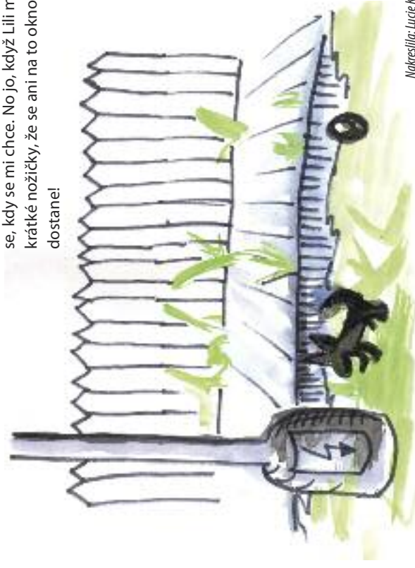
Nakreslila: Lucie Krajčířková