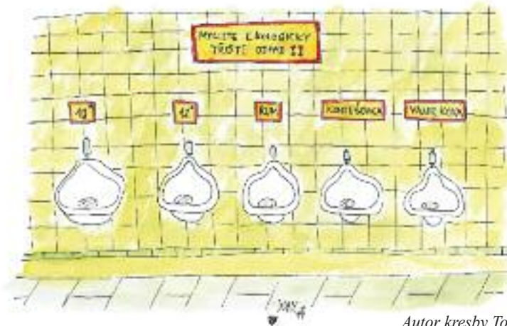
Autor kresby Tomáš Altman