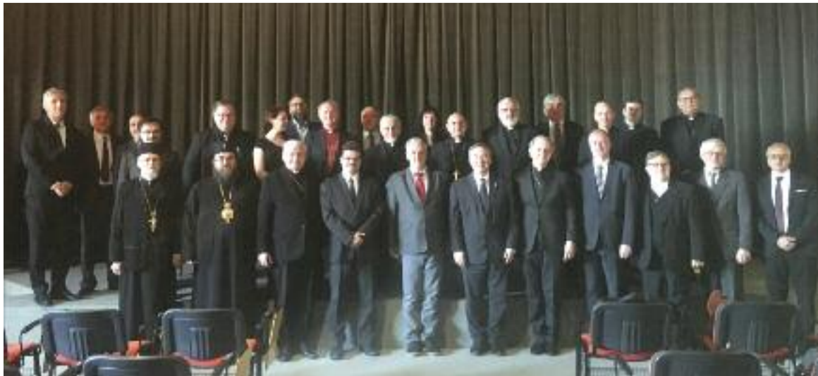
Ze setkání biskupů v Badině, str. 1