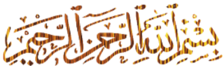
Basmala: Ve jménu Boha milosrdného, slitovného.