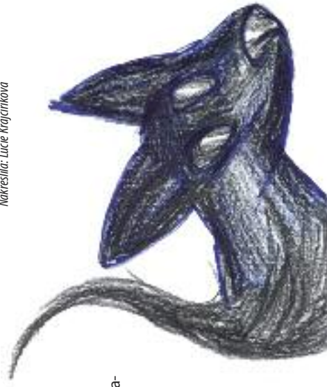
Nakreslila: Lucie Krajčůvková