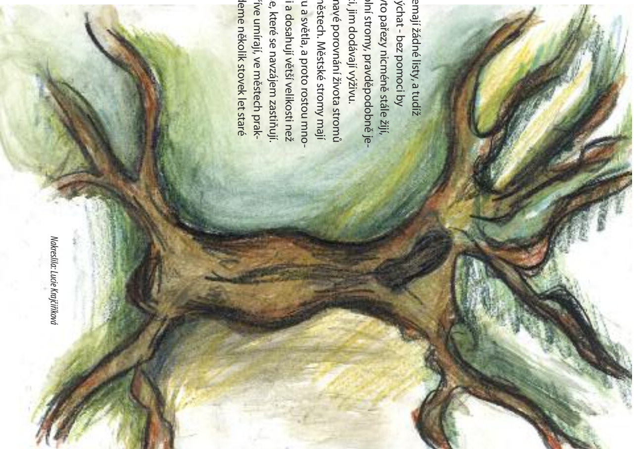
Nakreslila: Lucie Krajčirková

Je také zajímavé porovnání života stromů v lese a ve městech. Městské stromy mají více prostoru a světla, a proto rostou mnohem rychleji a dosahují větší velikosti než stromy v lese, které se navzájem zastíní. Také však dříve umírají, ve městech prakticky nenajdeme několik stovek let staré