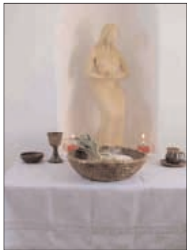
Soška patronky kaple

ve veřejné správě. V současnosti je proto vlastníkem objektu Město Jičín. Během staletí tento malý stánek Boží zažil mnohé. Například v roce 1968 zde na slámě žili sovětsí vojáci, kteří si kapli vybrali jako vhodné místo pro svoji vysílačku. Kapli vojáci používali jako snadný terč při střelbách z bývalého vojenského prostoru pod Zebínem.