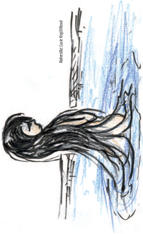
Nakreslila: Lucie Krajčůvková

a potom pokračovali do Malé Asie (dnešní Turecko), kde navštívili města Perge, Pisidskou Antiochii, Ikonion, Derbe. Všude seznamovali s Ježíšovým učením, křtili a zakládali křesťanské obce.