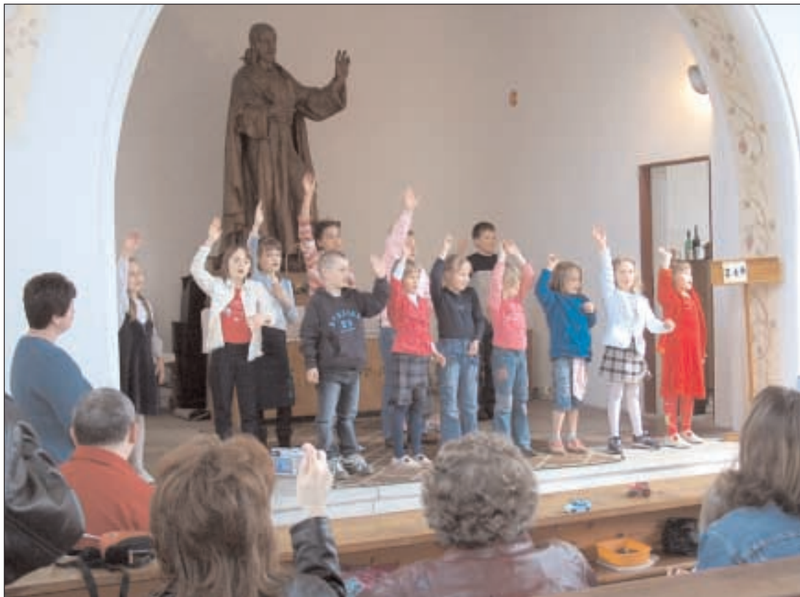
V našem sboru v Tuchoměřicích se 1. června tradičně scházejí děti