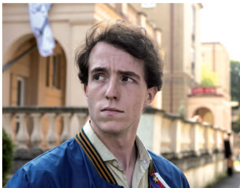
Z filmu Jan Palach

Film měl v kinech premiéru 21. srpna 2018 a jeho režisér Robert Sedláček patří u nás mezi uznávané tvůrce hraných a dokumentárních snímků. Pro ČT mimo jiné řekl, že ve svém posledním díle chtěl vyprávět tragický příběh Jana Palacha, jenž není dětsky naivním bojem proti totalitě, ale extrémním příkladem toho, kam až všudypřítomná konformita a přizpůsobivost dohnaná do krajnosti může zavést citlivého jedince. (jz)