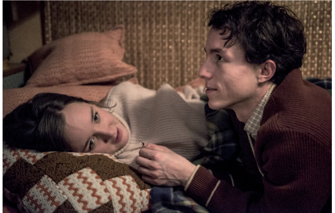
Z filmu Jan Palach

Ve filmu Jan Palach, který brzy uvede ČT, se tvůrcům podařilo vymodelovat ústřední postavu uvěřitelnou, umělecky pravdivou, a ne ovlivněnou nebo zabarvenou jakousi téměř nedotknutelnou a idealizovanou legendou. Vyhnuli se tomuto úskalí. Autorka scénáře i režisér vyšli z mnoha dostupných