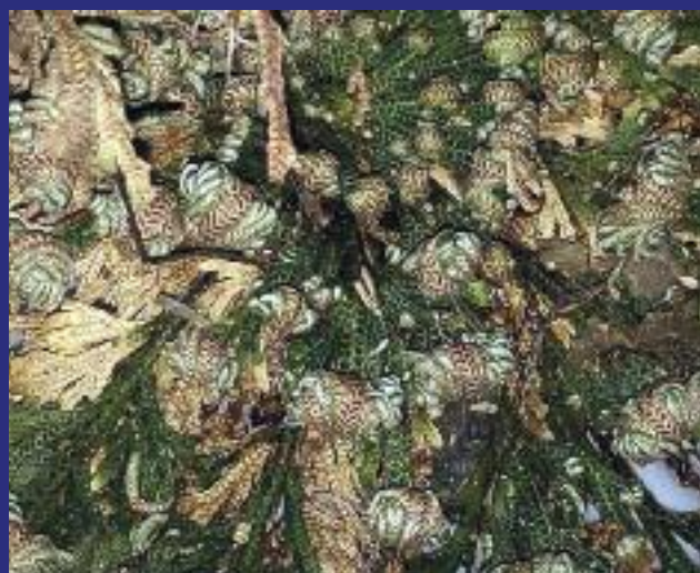
Zázračná rostlina zdobila vánoční stůl našich babiček, které ji přezdívaly Ruce Panny Marie nebo také rostlina vzkříšení. V některých zemích stále neodmyslitelně patří k vánočnímu období.