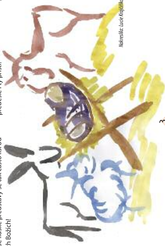
Nakreslila: Lucie Krajčířková