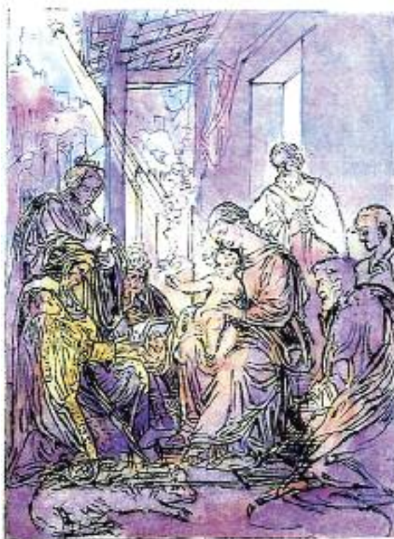
Klanění tří králů. Namaloval akademický malíř Josef Hošna. Více o autorovi a jeho tvorbě na: www.pametrnaroda.cz/story/hosna-josef

nami“ podle Bible kralické či požehnaná „nade všechny ženy“ podle Českého ekumenického překladu Bible (L 1,42). Narození z ženy vyjadřuje Ježíšovo opravdové lidství. Toto lidství se