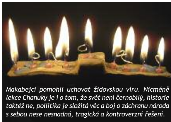
Makabejci pomohli uchovat židovskou víru. Nicméně lekce Chanuky je i o tom, že svět není černobílý, historie taktéž ne, politika je složitá věc a boj o záchranu národa s sebou nese nesnadná, tragická a kontroverzní řešení.

V současných interpretacích tedy společně s oslavou triumfu či opětovného zasvěcení chrámu a jeho oltáře (oběti dle předpisů Tóry tu byly opět zahájeny) silně zaznívá připomínka zázraku hořícího oleje. A tak díky symbolu plamene, světla, které je stěžejní metaforou