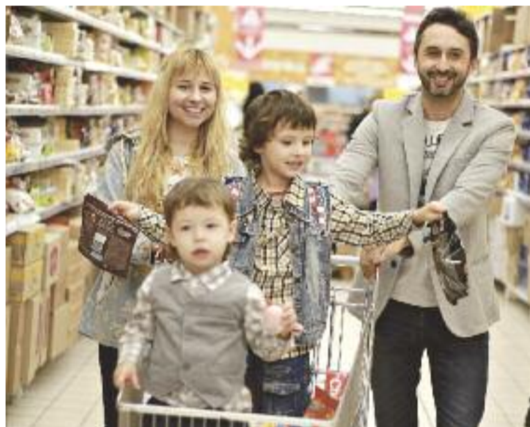
Většina z nás si může nakoupit potraviny, které potřebuje. Ne každý má to štěstí...