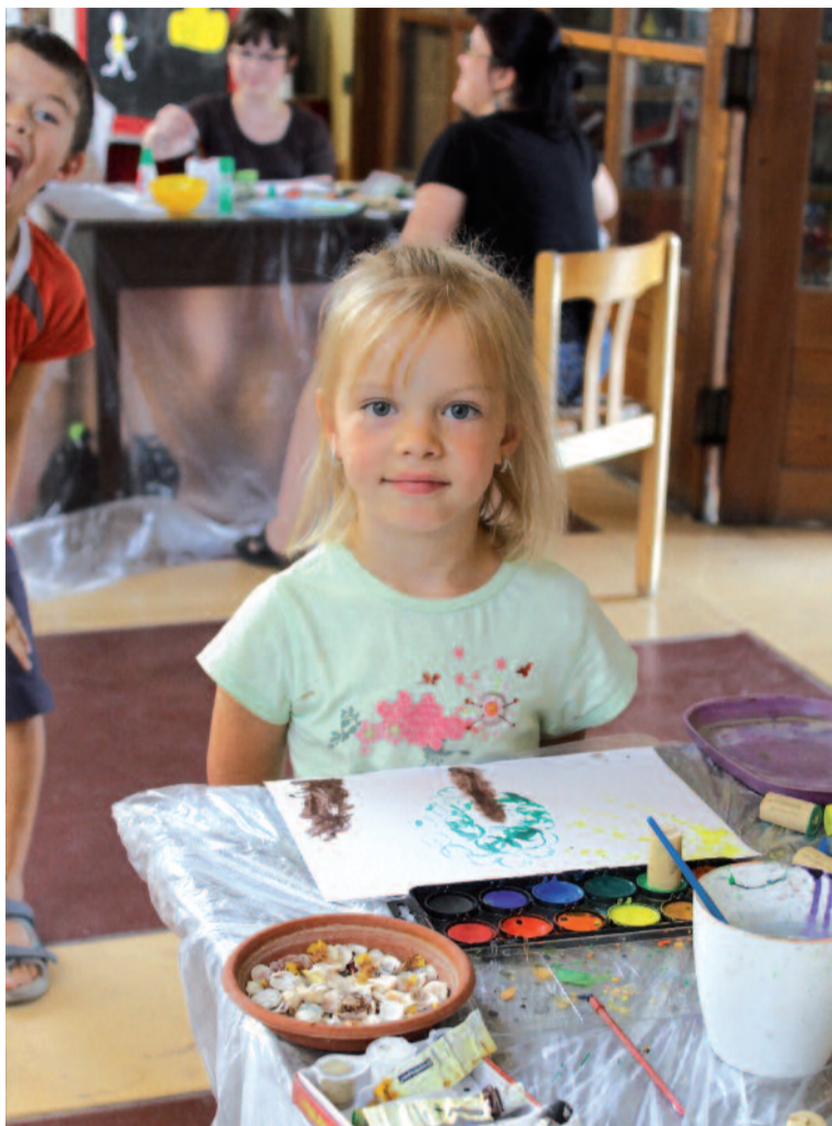
Z výtvarné dílny v Lounech 9. 8. 2018