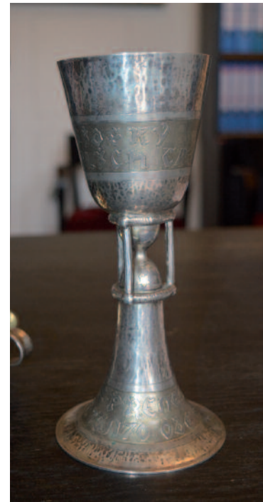
Bilkův kalich s motivem přesýpacích hodin