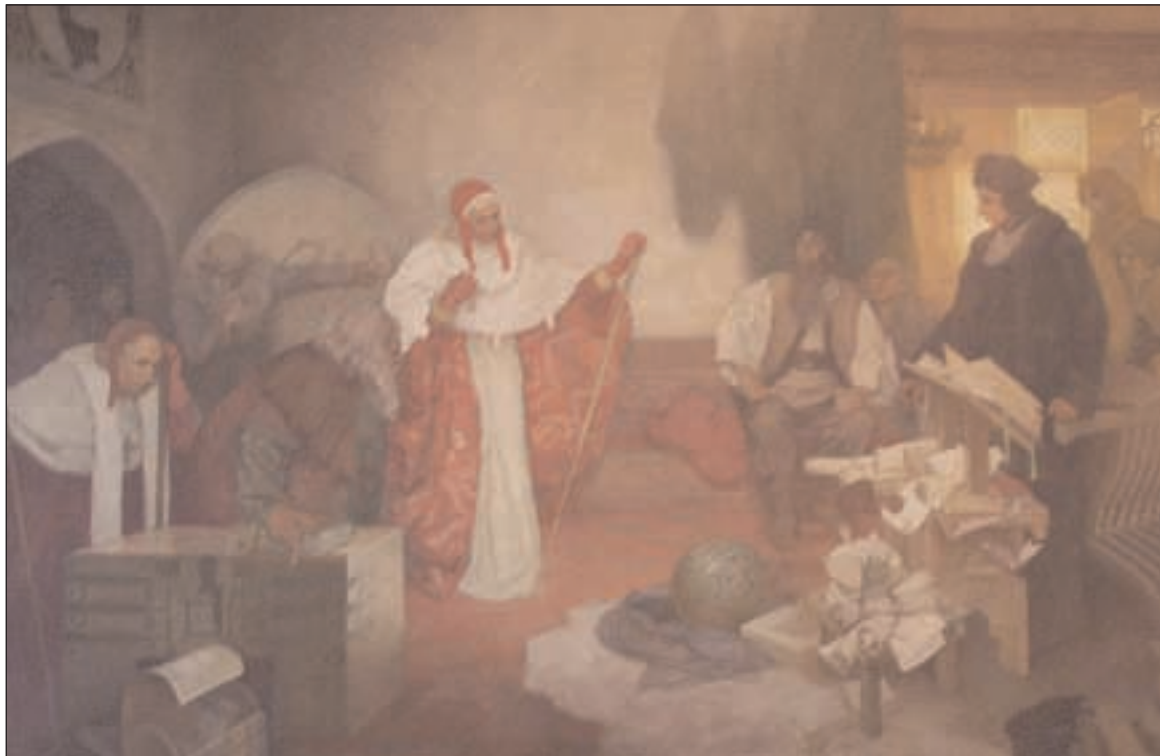
Obraz Jana Rokycany před Basilejským koncilem od slavného malíře Alfonse Muchy visí na rokycanské radnici

ENYA U nás 9, 147 00 Praha 4 tel. 241 483 743 e-mail: cejenya@mbox.vol.cz nebo přes NO Praha 4 – Michli a její farářku (viz spojení v kalendáři Blahoslav). (jk, em)