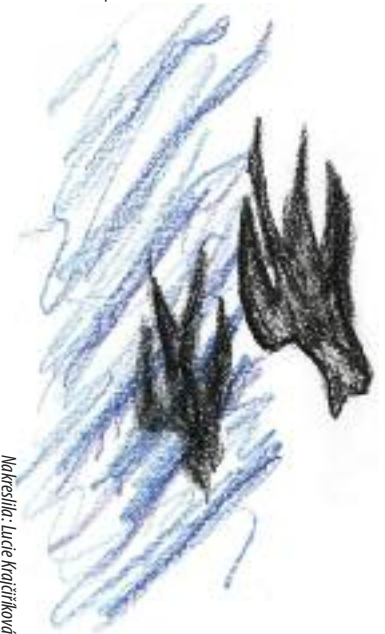
Nakreslila: Lucie Krajčířková

Pino Pellegrino Příběhy pro osvětlení duše