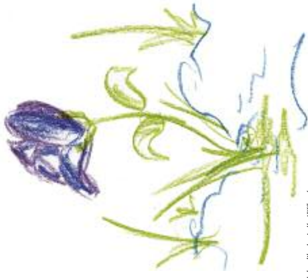
Nakreslila: Lucie Krajčířková