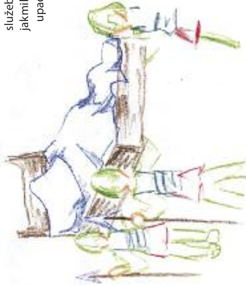
Kresba Lucie Krajčířikové

o přízeň Hospodina. Pomůže mu ovšem, když Davida zabije? Saul už nebyl schopen rozumně uvažovat. Jeho touha zbavit se Davida byla dokonce silnější než jeho nechuť znovu se setkat se Samuelem. Když však dorazil do Rámy, stalo se mu to samé, co jeho služebníkům. Spočínul na něm Duch Boží a Saul ležel celý den a celou noc v prorockém vytržení. Tak Bůh Davida ochránil.