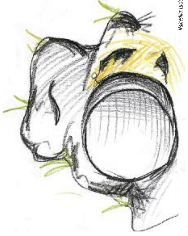
Nakreslila: Lucie Krajčířiková