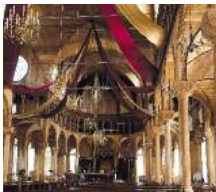
Dřevěný interiér katedrály sv. Petra a Pavla v Paramaribu.

Každá etnická skupina si přináší ze své původní země vlastní jazyk, tradice i náboženství. K tomu se přidává multikulturní rozmanitost umění, literatury, hudby, oblečení, tance, divadla i rozmanitost stravy - je proto obtížné uvést národní jídlo. Pro většinu skupin obyvatelstva je nicméně společným pokrmem rýže; podle zvyklostí ji doplňují rybami, kuřecím masem a nepřebornou škálou zeleniny, banány, batáty atd. Na více způsobů je také používán maniok, a to zejména k přípravě chleba. Nápoje jsou zpravidla sladké. Oblíbené je zázvorové pivo, sirup z citronové trávy či z kokosového mléka.