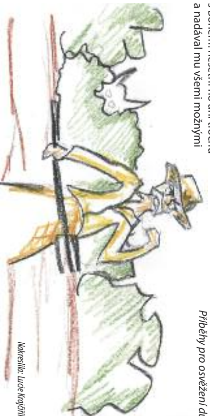
Nakreslila: Lucie Kratočková

Pino Pellegrino Příběhy pro osvětlení duše