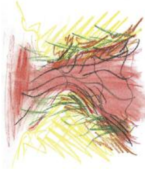
Nakreslila: Lucie Krajčířková

Teprve když i faraonův syn zemřel, dovolil panovník Izraelcům z Egypta odejít. Hospodin však jeho srdce dále zatvrdil, takže se rozhodl Izraelce pronásledovat. Na útěku jim pomohl další zázrak – Hospodin rozdělil moře, aby mohli projít, když však za nimi vešlo egyptské vojsko, moře se zase zavřelo a všichni pronásledovatelé se v něm utopili.