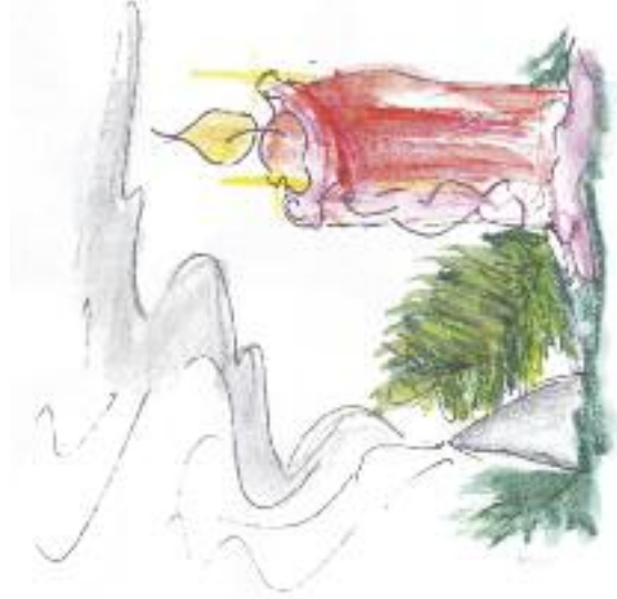
Nakreslila: Lucie Krajčířiková