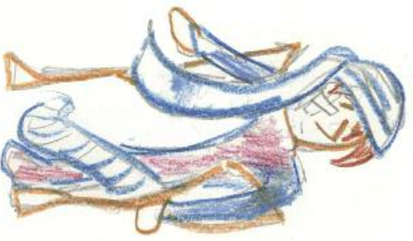
Nakreslila: Lucie Krájčířková

ani ve své nemoci se nedotazoval Hospodina, nýbrž vyhledal jen lékaře.“ Po dvou letech na svou nemoc zemřel. Tím samozřejmě nechci říci, že jsme-li nemocní, máme se spolehnout jen na Boha a k lékaři nechodit. Jde spíš o to umět se i v těžké nemoci odevzdat do vůle Boží, což nám pomůže lépe se se všemi útrapami vyrovnat. JK