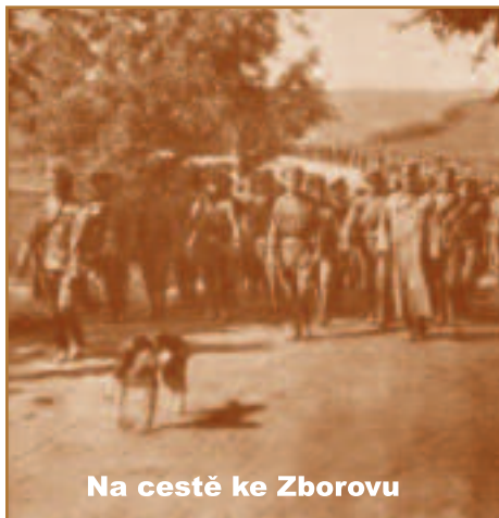
Na cestě ke Zborovu

Při slavnosti bude uvedeno dalších pět zvonů koncertní zvonohry - Václav Budovec, Kryštof Harant, Jan Jessenius, Matouš Ulický, Jiří Třanovský.