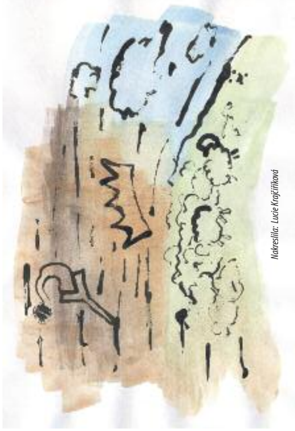
Nakreslila: Lucie Krajiříková