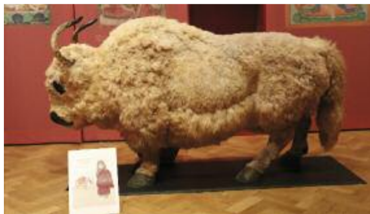
Obživu poskytují Tibetánům jaci. V horách se jich pase na 12 milionů.

dnes vysvětlují prudkými změnami teploty. Za zmínku stojí, že další cestovatel dorazil do Tibetu, konkrétně do Lhasy, až o 300 let později, v roce 1624. Vzhledem k tomu,