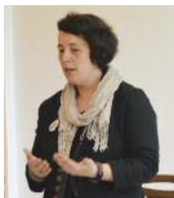
Na letošní teologické konferenci

♦ Na zmíněném brněnském setkání jsi mluvila o různých, řekněme, sociálních aktivitách, například v podobě filmových klubů či sou-