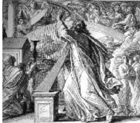
Král David zpívající žalmy za doprovodu harfy od G. Dorého.