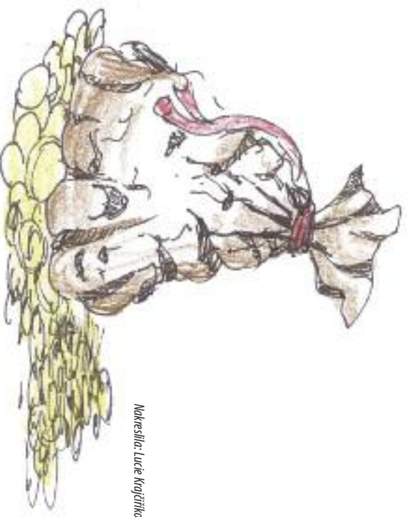
Malování: Luce Krážílková