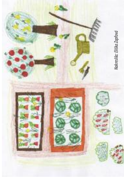
Nakreslila: Eliška Zápřavá

zahrádkářům pak začíná ta největší a dalo by se říci nekonečná práce. Chtějí-li mít záhonky pěkně čisté a úhledné, musí pravidelně plevel vytrhávat.