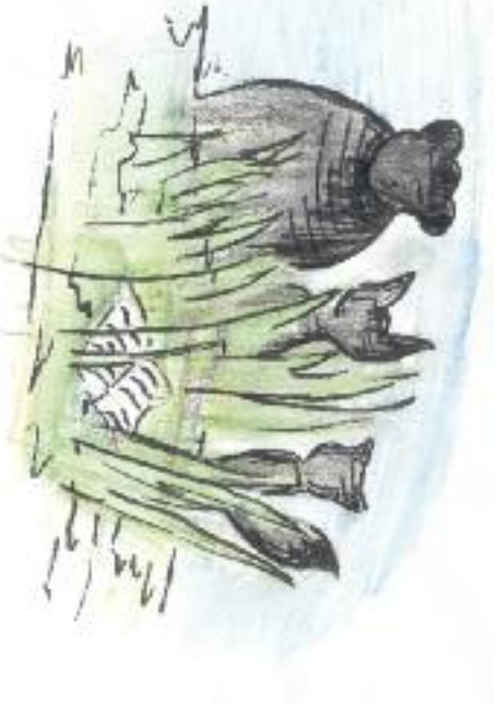
Nakreslila: Lucie Krajčůrková

„Musíme se postít“, prohlásil rezolutně. „To nám konečně pomůže dosáhnout dokonalosti.“ „Jak to myslíš, postít se?“ zeptala se liška. „Tady se piše,“ vysvětloval rys, „že půst znamená vzdát se všeho, co nás rozptyluje. Když to dokážeme, budeme dokonalí. Taky se tu říká, že u každého to jsou jiné věci – u někoho maso, u jiného cigarety, u dalšího televize atd. – to si podle té knížky každý může určit sám.“