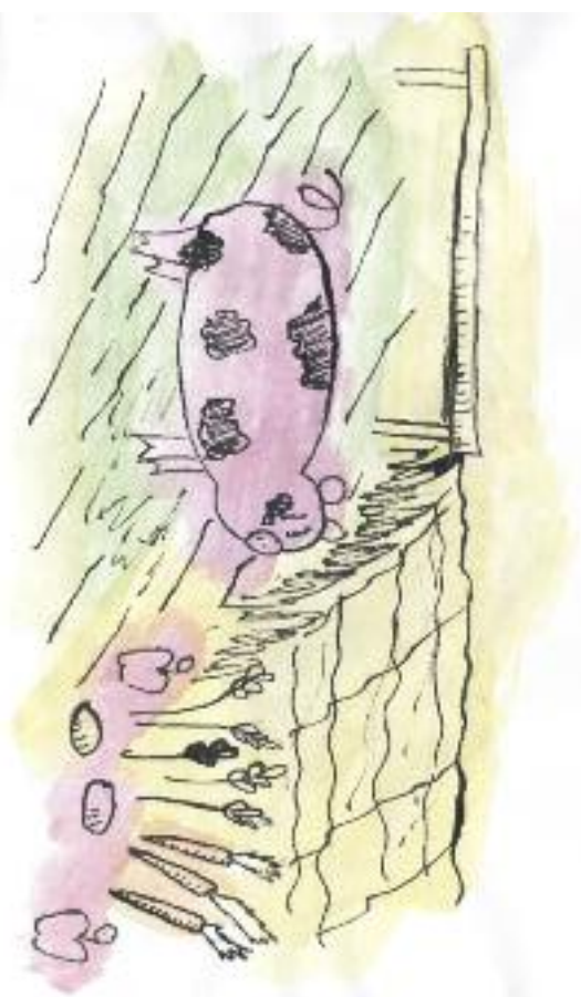
Nakreslila: Lucie Krajčůrková

P rožíváme teď právě předvelikonoční postní období. Jak jistě dobře víte, hlavně v dřívějších dobách byl půst spojen především s odprášením si masitých pokrmů. Je pravda, že pro chudé lidi bylo maso dlouhou dobu vzácností jednoduše proto, že pro ně bylo nedostupné. Proto třeba existuje celá spousta staročeských receptů z brambor, zelí, hub, hrachu, krup – prostě z toho, co bylo k dispozici. Dnes půst chápeme mnohem širěji než jen vzdání se masa – jde o to zřít se toho, co nás odvádí od Boha.