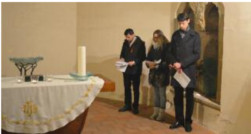
Tradiční, již 10. ekumenická slavnost pro studenty, děkany, pedagogy a zaměstnance teologických fakult v rámci Týdne modliteb za jednotu křesťanů proběhla v úterý 24. ledna v malostranském kostele sv. Jana Křtitele Na Prádle.