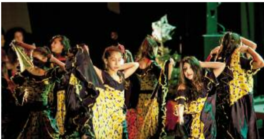
Před Vánoci proběhla v pražském divadle Ponec výjimečná akce Bachtaři Karačoha - Veselé Vánoce 2016. Vznikla díky spolupráci Nizkoprahového klubu Husita se ZŠ Cimburkova a divadlem Ponec. K akci se vrátíme v dalším čísle.