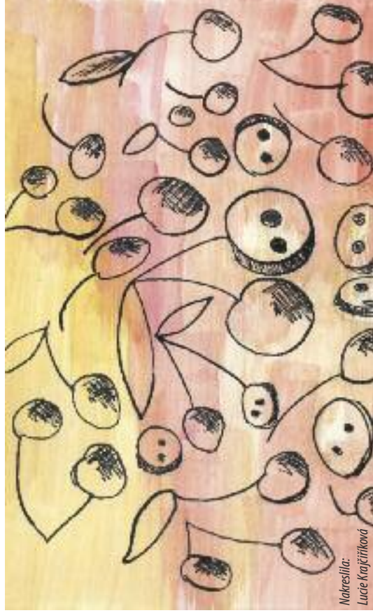
Nakreslila: Lucie Krajčířková