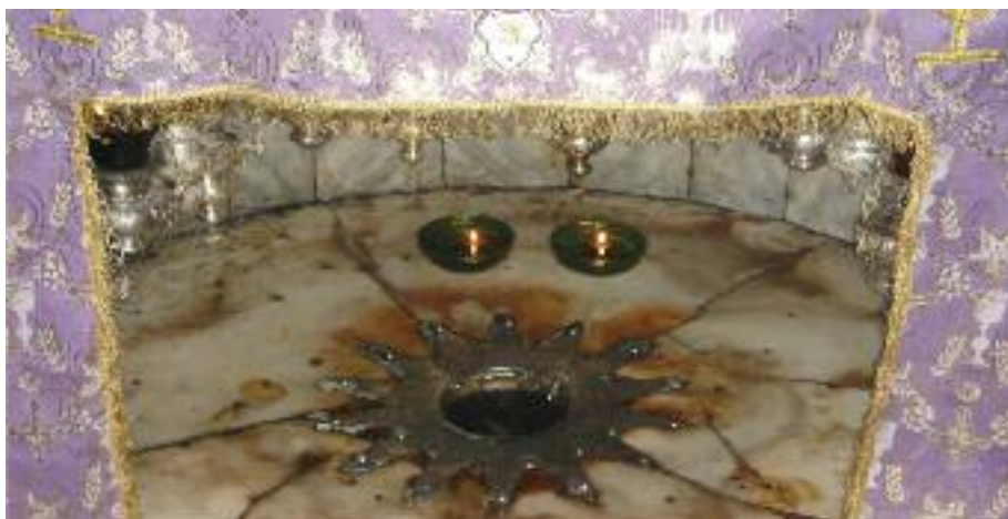
V jeskyni Božího narození v Betlémě