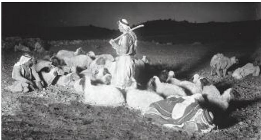
Pod Betlémem, cca 1920-33, foto American Colony (Jerusalem), Library of Congress

Vánoční příběh podle evangelisty Lukáše z 2. kapitoly má dvě roviny, dvojí rozměr. Na jedné straně se odehrává v prostoru tohoto proměňujícího se světa a na druhé straně v oblasti věčného Bo-