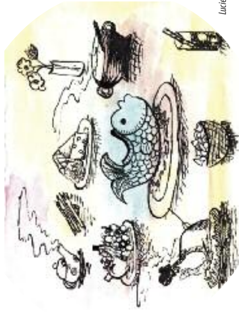
Nakreslila: Lucie Krajčířková