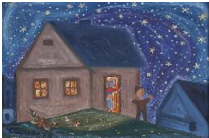
Josef Čapek. Hvězdy, 1936, Památník národního písemnictví v Praze

A na zemi pokoj lidem dobré vůle. Je to ta nejkratší modlitbička; kdybyste ji tisíckrát opakovali, jako byste měli v sobě tibetský mlýnek na modlení, po každé v ní najdete novou a libou chuť. Neboť je v ní sláva i výsosti, země i pokoj