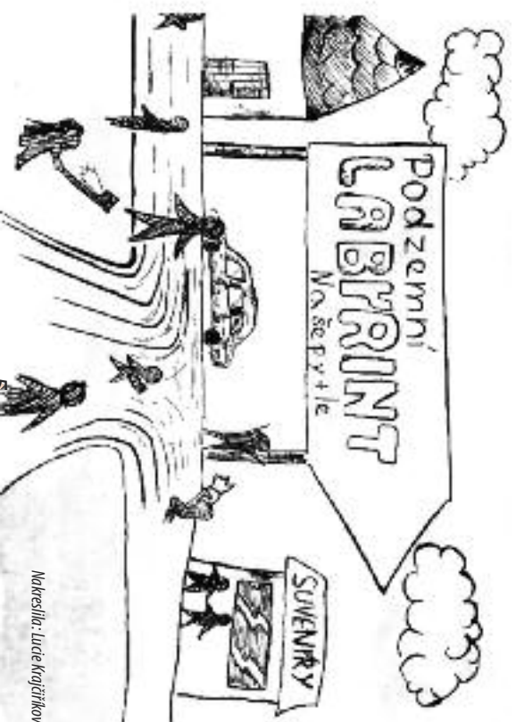
Nakreslila: Lucie Kratočvířková