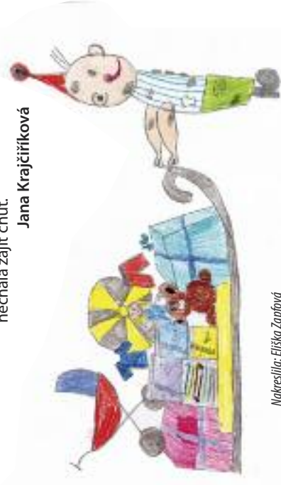
Nakreslila: Eliška Zapřová