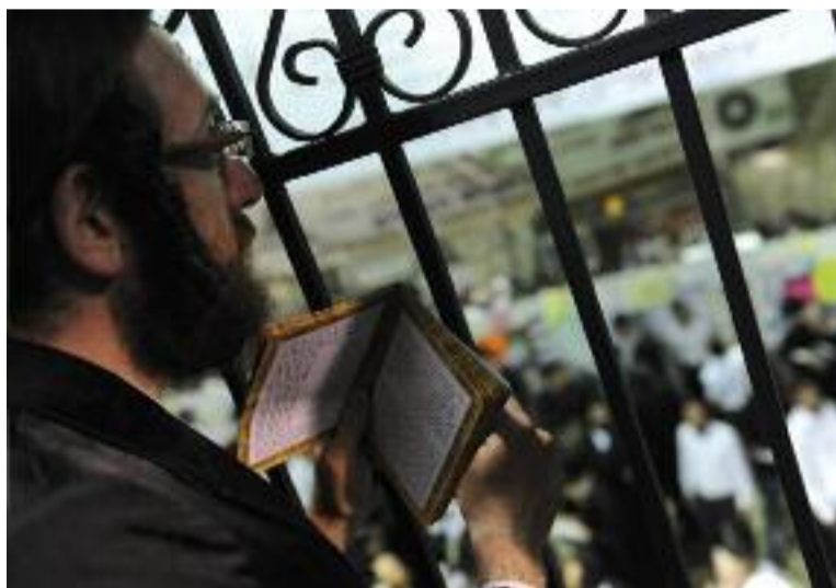
Ilustrační foto, autor: Karel Cudlín