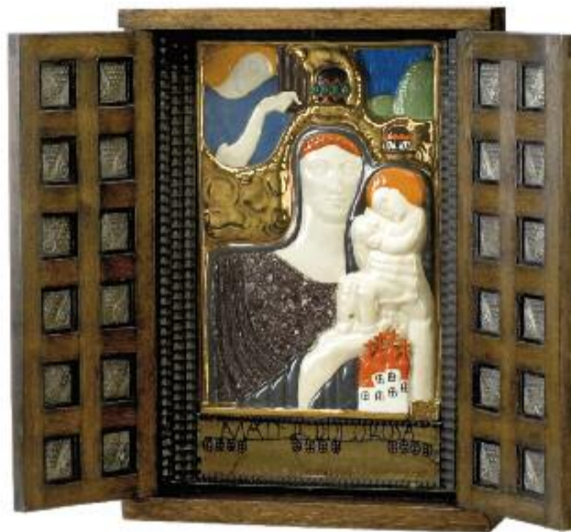
Domácí oltářík vytvořil Jaroslav Horejc pro svou maminku. Autorem skříně je Jan Kotěra. (Zhotoveno v letech 1909–1910, Uměleckoprůmyslové museum v Praze)