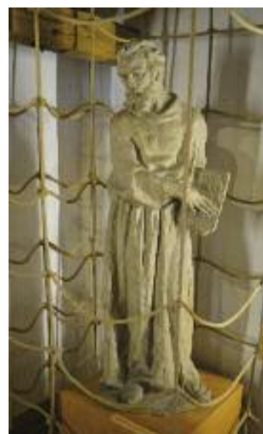
Interiér památníku Petra Chelčického v Chelčicích