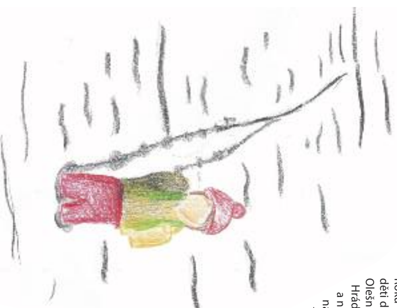
Nakreslila: Lucie Krátkáková

Antonín Boš: Kronika obce Dlouhé-Rzy v Otlických horách, 1940