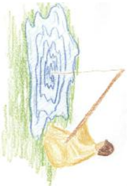
Nakreslila: Lucie Kojčičková

A vidíte, sám Ježíš si své učedníky také povolal – a poměrně radikálním způsobem – jakmile je oslovil a řekl: „Pojďte za mnou!“, rybáři zanechali své sítě, celník přestal vybírat daně, prostě všichni všeho nechali a následovali jej. Změnili svou profesi – stali se z nich učedníci. Myslíte, že to není