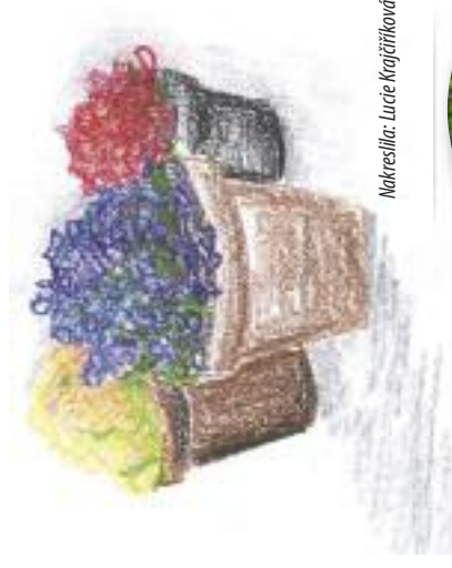
Nakreslila: Lucie Krajčírřiková

„Chťel bych je něčím rozveselit, něčím hezkým, barevným, něčím, co vydrží...“ Chvilku přemýšlel a potom zvolal: „Už to mám!“