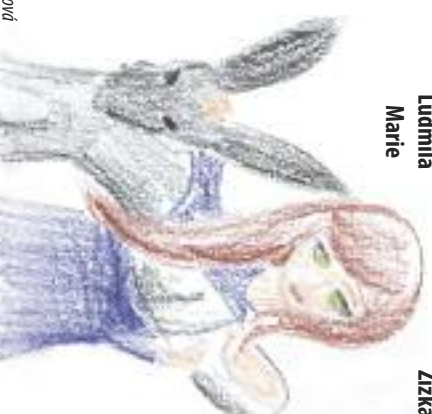
Nakreslila: Lucie Kojčičková