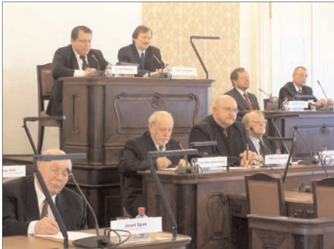
Ze vzpomínkové akce k 157. výročí narození Tomáše Garrigua Masaryka v Parlamentu ČR - k článku na str. 3