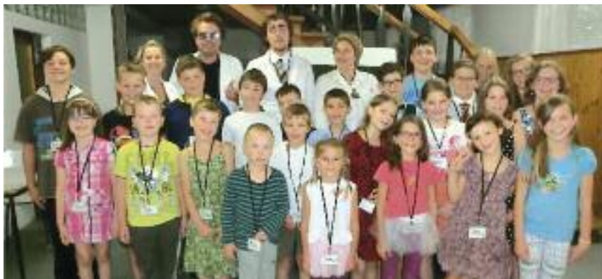
25 dětí se ve dnech 6. - 13. srpna účastnilo letního tábora Vápenná. Podrobné informace z pera sestry Ivany Krejčí přineseme v příštím čísle.