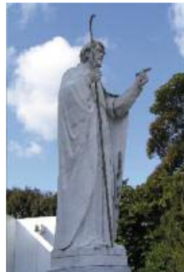
Socha sv. Františka Xaverského

věřících; větší uskupení čítající 500–600 věřících vznikala spojením několika menších skupin. Malé skupiny měly obvykle dva vůdce, hlavního a jeho pomocníka, ti byli také mezi vedením větších organizací. Dohledem nad činností žen byla pověřena vždy jedna ze starších žen. Členové bratrstev pomáhali s evangelizací, věnovali se charitativní práci a setkávali se při bohoslužbách, soukromých pobožnostech, četbě posvátných textů a při studiu náboženství. Skrytí křesťané měli i svůj liturgický kalendář, který řídil jejich aktivity. Všechny kostely byly zbořeny, setkání se proto konala v soukromých domech. Bratrstva připravovala své věřící i na hrozbu mučednické smrti. I když se křesťané nacházeli