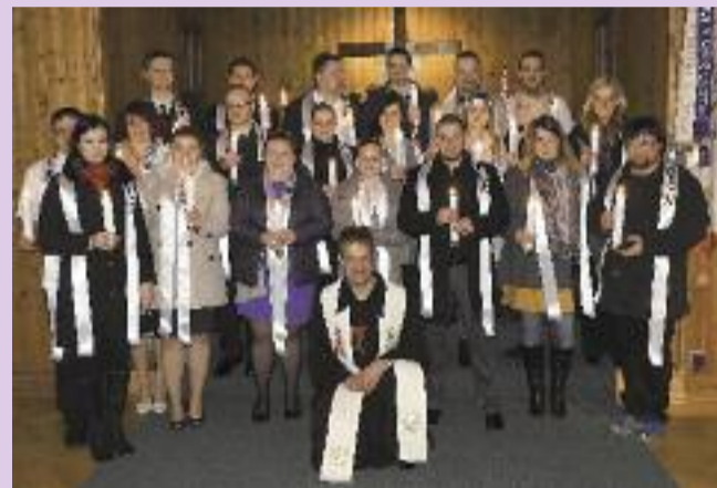
Křest 22 dospělých na Bílou sobotu v Blansku. Blahopřejeme. red