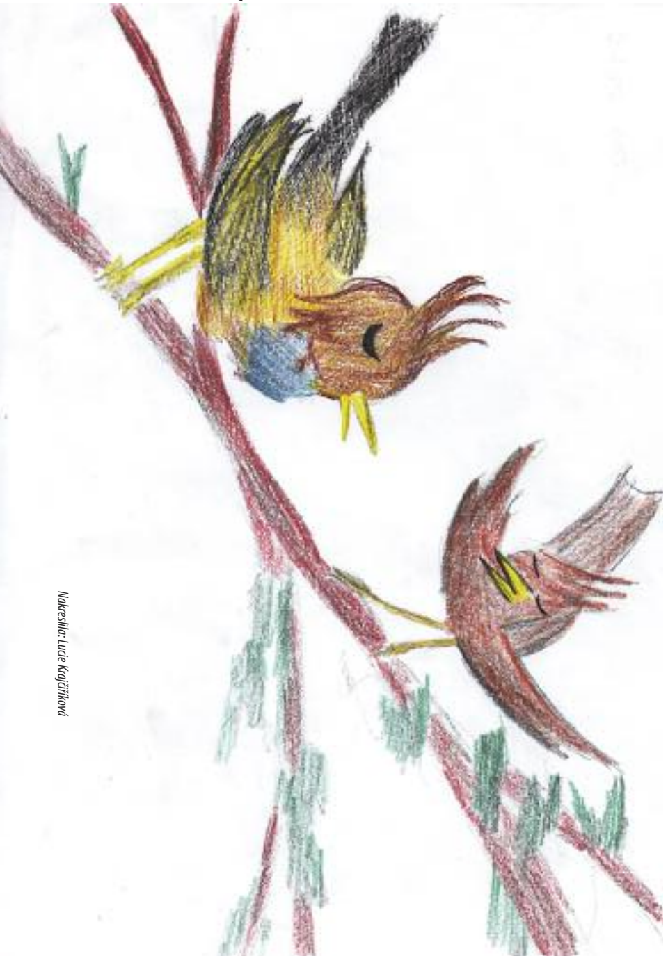
Nakreslila: Lucie Krajčířiková

Tou největší cti je ovšem právo a zároveň povinnost dát pokyn k zahájení zpěvu. Tento úkol zastává každý ptáček jenom jedinkrát za život a svědomitě se v něm střídají, aby ani jeden nebyl opomínut. Nikdo neví, jak k tomu dochází, zda snad někde existuje nekonečný seznam všeho praxta, podle kterého je určováno pořadí těchto ptačích „dirigentů“. Jisté však je, že každý den se v jednom hnízdě či ptačí budce, u křídla jednoho ptáčka, objeví malá zlatá taktovka. Vybraný ptáček, jakmile ji spatří, ví přesně, co a kdy má udělat. Rozechvěle čeká na větvici na okamžik, kdy mu v hlavě zazní signál: „Teď!“