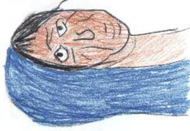
Nakreslil: Fera Krajčířik