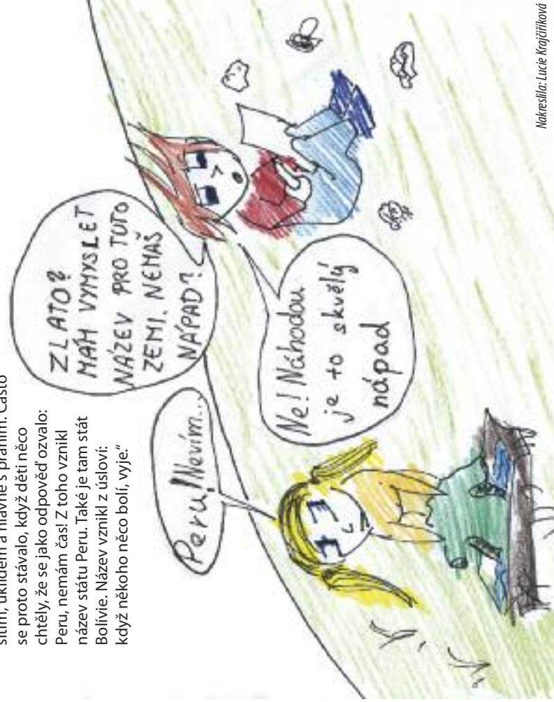
Nakreslila: Lucie Krajčířiková