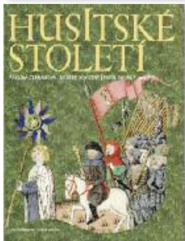
Sborník Husitské století - viz upozornění na knihu br. Hobzou na str. 3