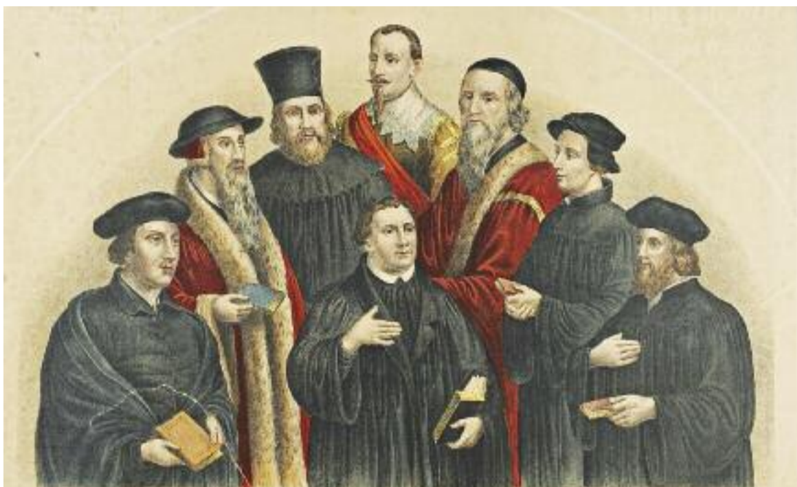
Muži reformace: zleva - Filip Melancthon, Jan Kalvin, Jeroným Pražský, Martin Luther, Gustav Adolf, Jan Amos Komenský, Ulrich Zwingli, Jan Hus.