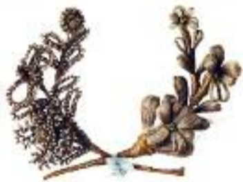
Brož z vlasů Boženy Němcové

Výstava s názvem Slavné pohřby netradičním způsobem představuje osobnosti českých dějin od 19. do 21. století i klíčové historické momenty. Je pokračováním cyklu Národního muzea s názvem Smrt a lze ji navštívit až do 31. března v Národním památníku na Vítkově.