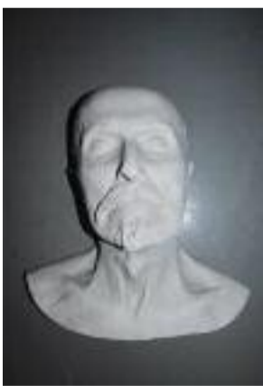
Posmrtná maska TGM

Slavné pohřby byly v minulosti vyhrazeny pro vládnoucí politické a církevní osobnosti. Až od národního obrození se této pocty začalo