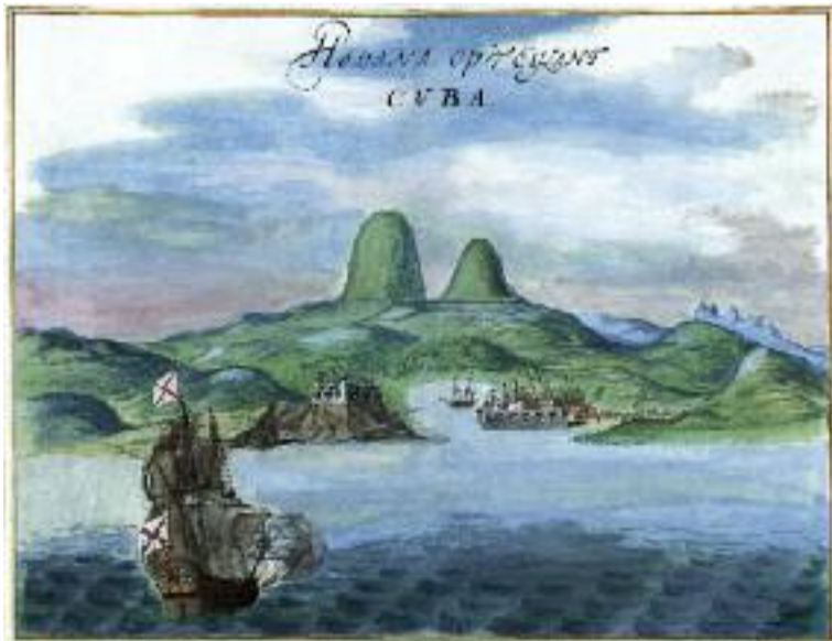
Havana očima holandského malíře a kartografa Johannese Vingboonse v roce 1639.

„Kuba je zemí mnoha tváří a místem věčných protikladů, které se snoubí v podmanivý celek.“