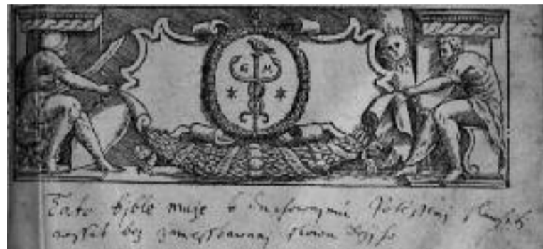
Bible s cenzurním přípisem A. Koniáše.

(České muzeum hudby, Karmelitská 2/4, Praha - Malá Strana) VD