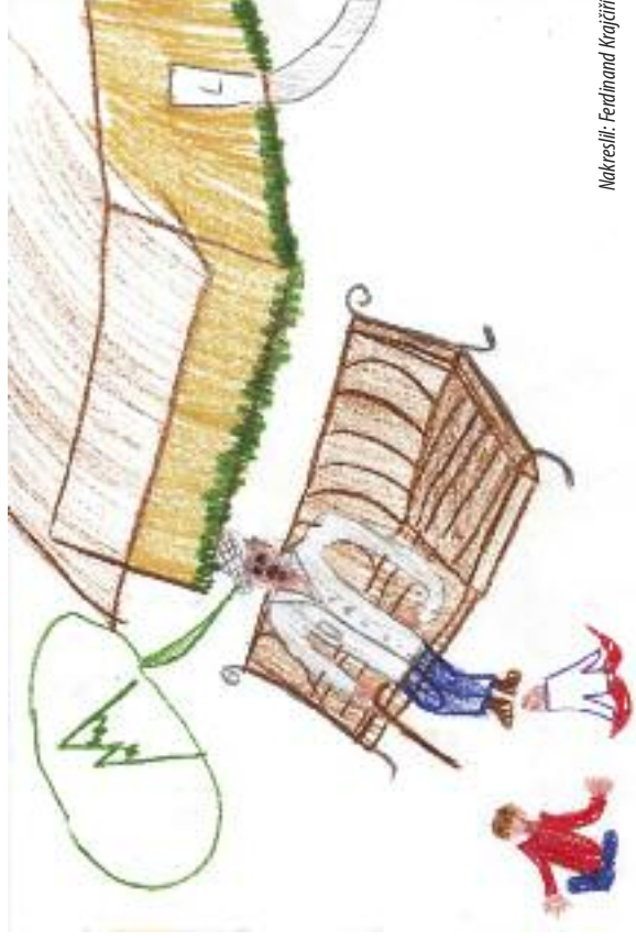
Nakreslil: Ferdinand Krajčířik