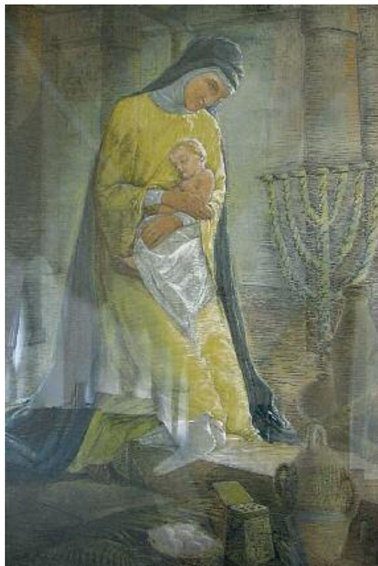
Obraz „Matka radostná“ od Františka Bilka v Husově sboru v Českých Budějovicích. Na rámu obrazu je nápis: „V Betlémě ho porodila, v chrámu obětovala a v chrámu nalezla a životem provázela“.

„Jak dostupnost nerostných surovin ovlivňuje naše životy: ohlédnutí, současnost a odhad budoucího vývoje“ je téma únorové besedy Ekologické sekce České křesťanské akademie, při níž promluví geoložka RNDr. Zdeňka Petáková. Upřímně zveme k setkání nad tímto aktuálním tématem, k němuž se sejdem v úterý 9. února v 17.30 h v přízemí pražského kláštera Emauzy. JNe