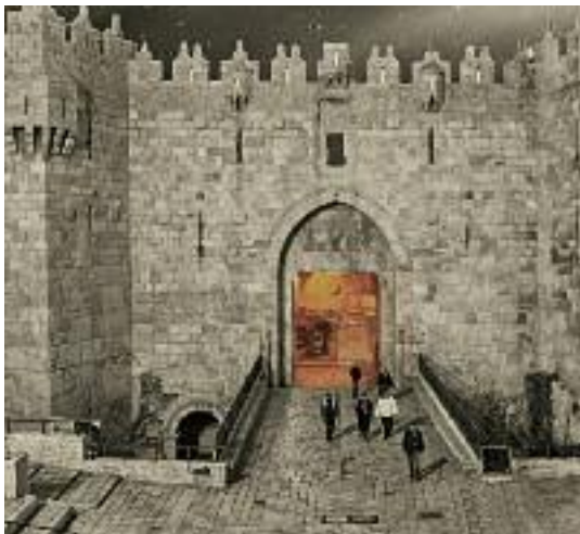
Damašská brána, Jeruzalém.

Abraham zosobňuje víru, která prochází zkouškami (Gn 22,1-24). Je příkladem víry, která nechce roztržky (Gn 13,8) a která se přimlouvá za druhé a za svět (Gn 18,16-33). Abrahamova víra je živým jádrem rozmanitých a rozdílných náboženských tradic.