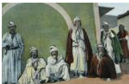
Jezídové, historické foto, Wikipedia

Jezídové jsou etnický Kurdové (mluví kurdsky), leč vyznávají specifické náboženství, které z nich vlastně činí svěbytnou nábožensko-etnickou skupinu, přičemž oni sami se považují za zvláštní národ – je tedy též sporné, zda je psát s velkým, nebo malým „j“.