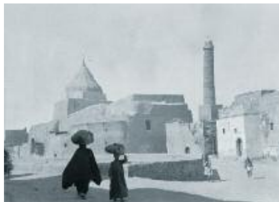
Na fotografii asi z počátku 20. stol. jezídská svatyně v iráckém Mosulu, který je dnes v rukou Islámského státu. Svatyně tedy nejspíš již nestojí.

Sami Jezídové se za vyznavače d'ábla rozhodně nepovažují (ostatně, plameny pekla prý uhasil Paví anděl svými slzami, jež shromáždřoval po sedm tisíc let v sedmi nádobách), nicméně tato skutečnost jim v minulosti nebyla moc platná – nařčení tvořilo jednu z hlavních příčin jejich pronásledování muslimy. Za pár posledních staletí tak bylo vyvražďeno až