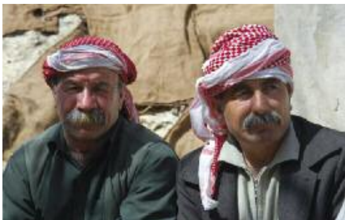
Současní Jezidové, foto: Wikipedia

lezl pouze odporný hmyz, z Adamova se narodil krásný chlapec, který je praotcem všech Jezidů. Tím se tedy liší od ostatních obyvatel Země, kteří pocházejí z pohlavního spojení Adama a Evy. Jezidové jsou si své výjimečnosti dobře vědomi a mají přísně zakázáno se ženit nebo vdávat s nejezidy; obecně se doporučuje kontakt s vnějším světem omezit na minimum,“ uvádí v článku zveřejněném na webových stránkách FFakt Barbara Oudová Holcátová. Nutno dodat, že Adamův „samosyn“ zplodil první Jezidy pravděpodobně s huriskou, neboli, zhruba řečeno, s vílou z ráje.