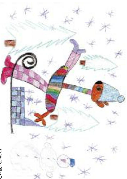
Nakreslila: Eliška Zapřová, 5 let