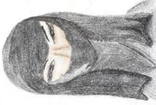
Makreslila: Lucie Krajčříková

pouhý šátek na hlavě. Postupně tento zvyk téměř vymizel, avšak před zhruba 40 lety nastalo jeho oživení. Dnes jde většinou o dobrovolnou volbu muslimských žen, pro které je symbolem úcty a rovnosti. Nechtějí být posuzované podle toho, jak vypadají, ale podle svých schopností.